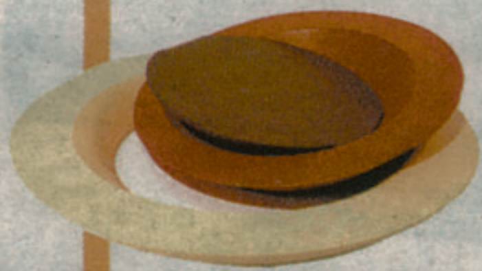
MATALI CRASSET Lanciata e affermata Scoperta dal SaloneSatellite, per Alessi ha realizzato Essentiel de pâtisserie, strumenti per aspiranti pasticciere